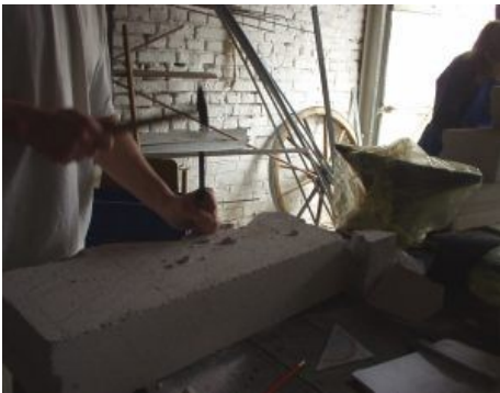
mit Hammer und Meißel