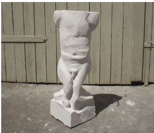
Skulptur aus einem Stück gehauen

Zur Haltbarmachung werden die Skulpturen anschließend mit Feinmörtel verspachtelt. Hier können auch noch kleine Unebenheiten und Risse ausgeglichen werden. Anschließend erfolgt ggf. die farbliche Gestaltung mit Dispersionsfarbe.