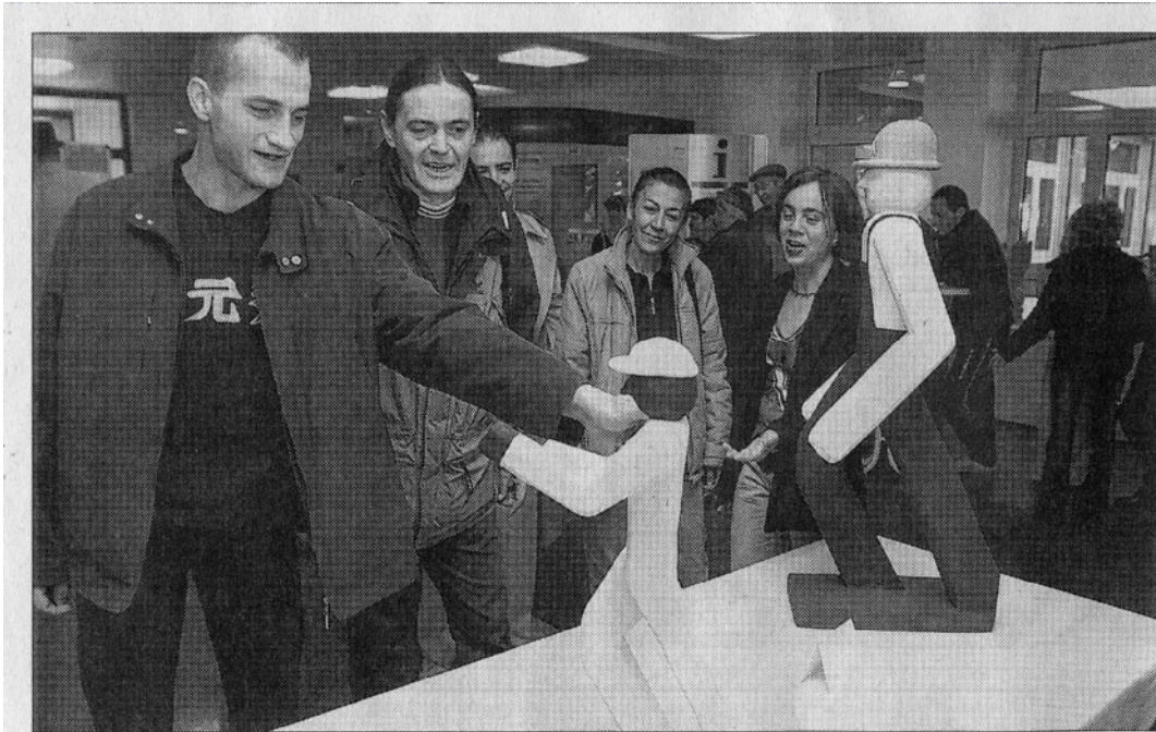
»Arbeiter« aus Ytong-Steinen hat ein Erwerbsloser geschaffen. Im Ausstellungskatalog wird deutlich, dass er gern selbst noch so tatkräftig wäre, wie sein Werk wirkt: »15 Jahre Baustellenerfahrung – Fassade, Tiefbau, Hochbau, Fliesen... – und trotzdem keine Arbeit!«