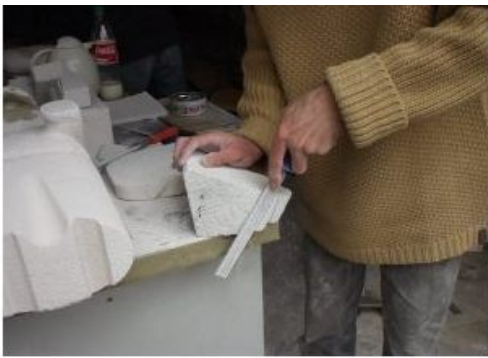
Formgebung mit Raspel und Feile